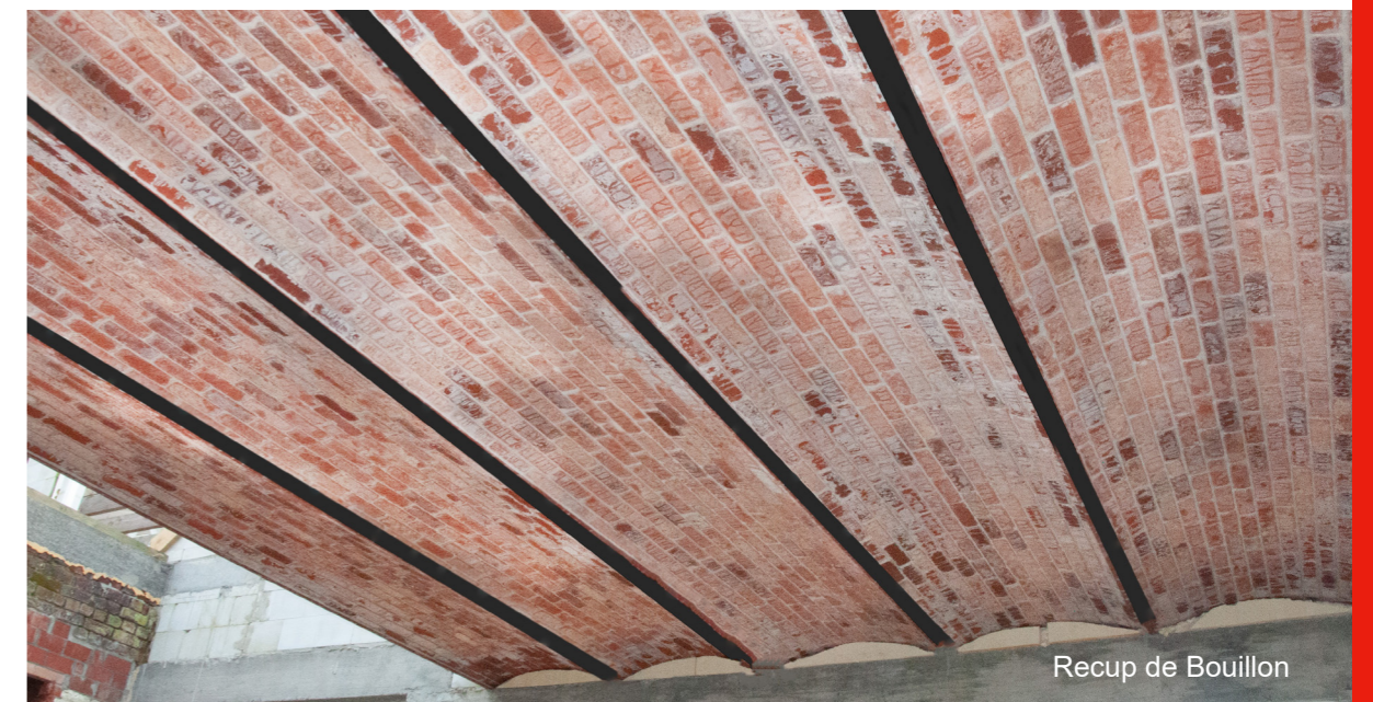
Recup de Bouillon